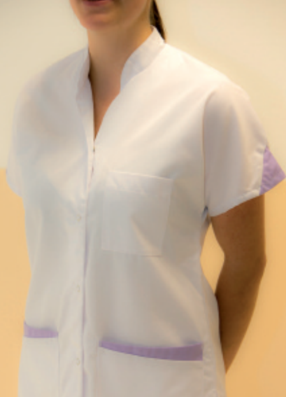
L'adetta alla ristorazione